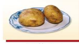
200g khoai tây