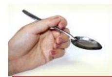
Muỗng dầu ăn

1 đơn vị thực phẩm chứa lượng chất béo tương đương với 5 g