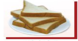
2.5 lát bánh mì