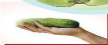
150g dưa leo