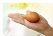
67g trứng gà