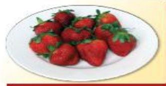
150g dâu tây