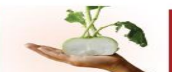
150g su hào