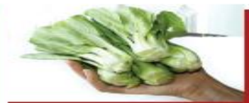
200g cải thìa