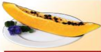
200g đu đủ