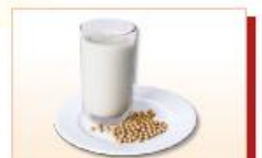
Sữa đậu nành