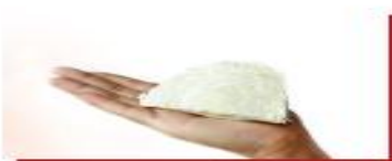
90g bắp cải