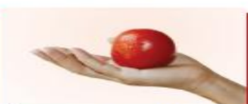
120g cà chua