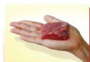
50g thịt heo