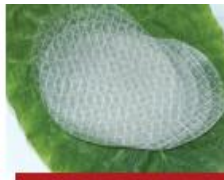
60g bánh tráng