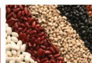
các loại đậu

1 đơn vị thực phẩm chứa lượng đạm tương đương với 10g