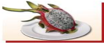
250g thanh long