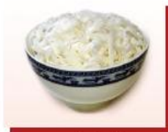
140g bánh phở