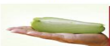
100g su su