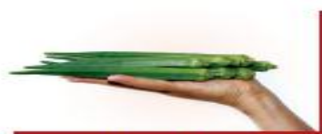
100g đậu bắp