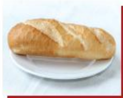
80g bánh mì