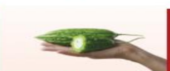
150g khổ qua