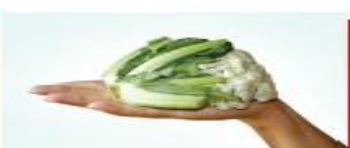
100g bông cải