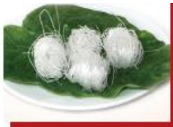
50g bún khô