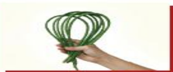
50g đậu đũa