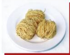
60g mì sợi

1 đơn vị thực phẩm chứa lượng bột đường tương đương 45 g