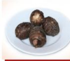
170g khoai sọ