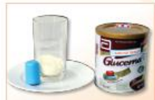
1 đơn vị sữa 26,7 g bột